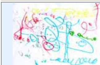
Tabitha gaat op kamp