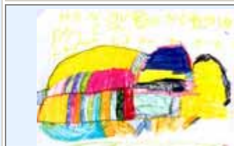
Monique gaat op kamp