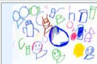
Kynan gaat op kamp